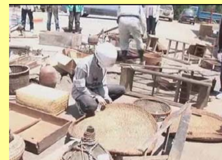
山古志民俗資料館収蔵品救出プロジェクトの記録 -2005年5月21日～22日 より