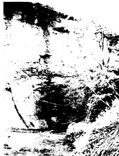
写真-1 東川右支川河川トンネル入口

この河川トンネルのある旧松之山町は、過去に多くの地すべりが発生しており、町全体が地すべり地帯のような地域である。このことから、この場所で地すべりが発生していた可能性は大いにあるだろう。また『新潟の地すべり1984』によると、松野山の最南の中尾集落で享保年間(1716~36)に地すべり防止のために部落民を挙げて捷水隧道を掘削したとある 6) 。このようなことから、この東川右支川の河川トンネルも地すべり対策によるものだと考える。