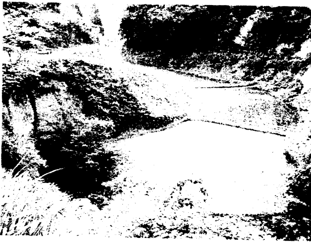
写真-3 東川右支川旧河道