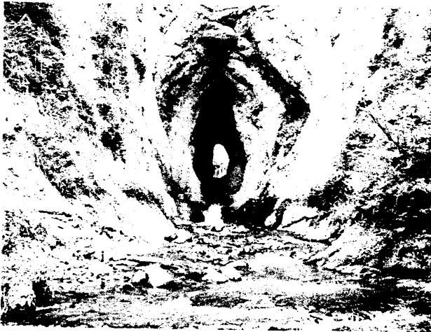
写真-2 東川右支川河川トンネル出口