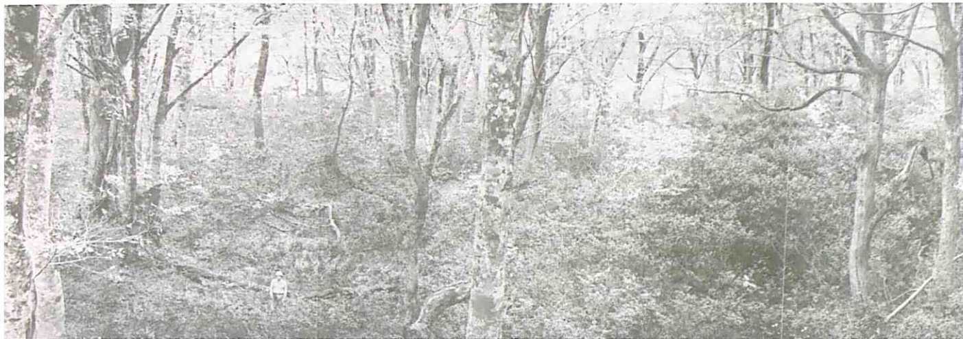
北蒲原郡黒川村奥胎内川本流 400m (1989,11,4)