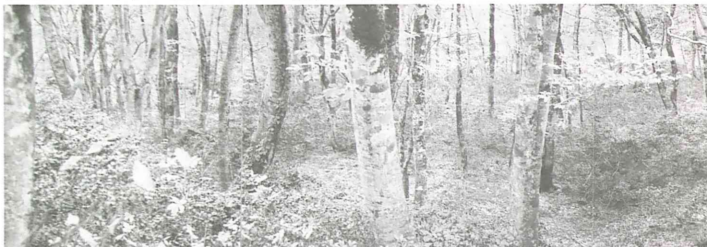
表1 ブナ・ユキツバキ群落の所在地