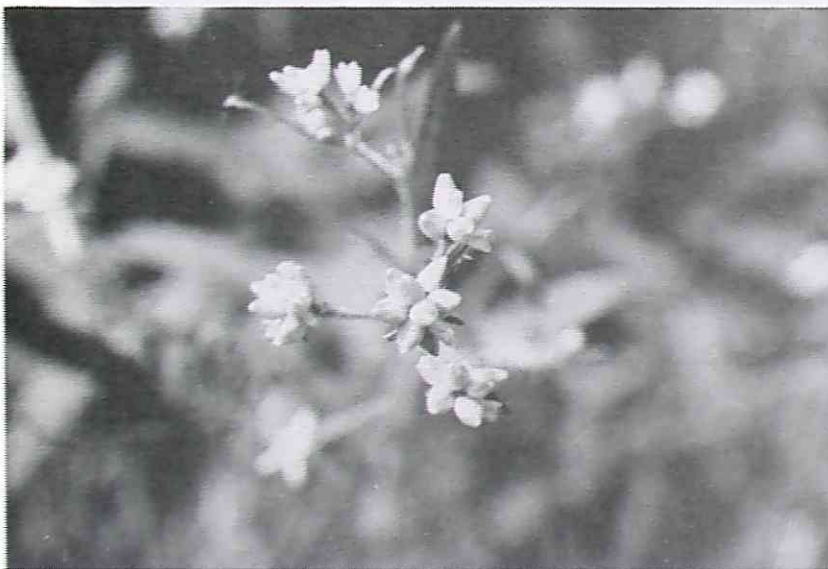
サデクサ (タデ科) 1989.10.1

サデクサは県内数ヶ所だけに生育している貴重な植物である。1990年に新潟市の公園整備事業で佐潟の湖畔の一部が埋立てられ、本種の主要な生育地が消失してしまったことは極めて残念なことである。