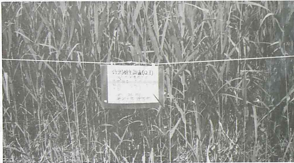
Q1 1ヶ月半でヨシは以前と同長となる。