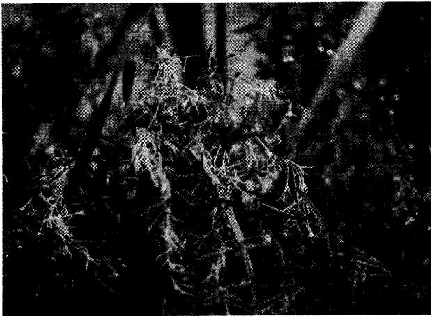
写真1 自生地における生育状況 佐渡相川北狄 (1996 9/22 撮影)