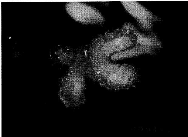
写真3 花 (柱頭4裂) ×16 新津資料室栽培 (2008 7/9 撮影)