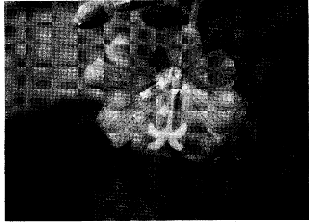
写真2 新津資料室栽培 (2008 7/9 撮影)