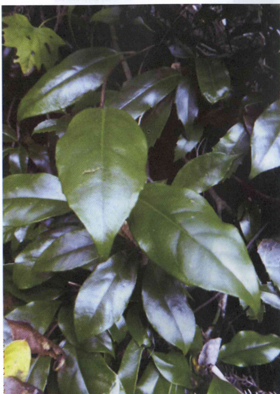
写真1 新潟市の秋葉区金津の生育地 (2010年11月17日)

石沢 進 (1998) 越後新津丘陵 里山の植物 :67, 新潟県都市緑化センター.