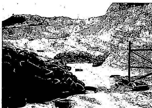
写真-3 古タイヤの仮置き

マレーシアでも大都市の人口増加、利便性や快適性を追求した人間活動の拡大は、生活ゴミの大量廃棄を生みだし、大きな社会問題になっている。