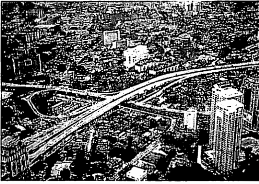
写真-5 緑との調和が美しいクアラ Lumpur 市街地