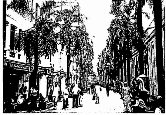
写真-6 クアラ Lumpur 市内の街路樹

入れており、観光客をひきつけるに値する都市であった。緑豊かな広い公園や、色彩豊かなハイビスカスやブーゲンビリアという熱帯特有の植物をいかした生け垣が見られ、また、街路樹が植えられた通り（写真-6）には至る所にゴミ箱が設置され、街は整然とした美しさを保っていた。