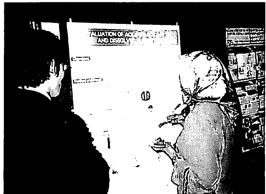
写真-1 ポスター会場風景

Poster発表は、2日間継続され、発表者は一定時間その説明を義務付けられていた。各国の環境問題について興味深い研究が沢山あり、face to faceで意見交換がなされた(写真-1)。