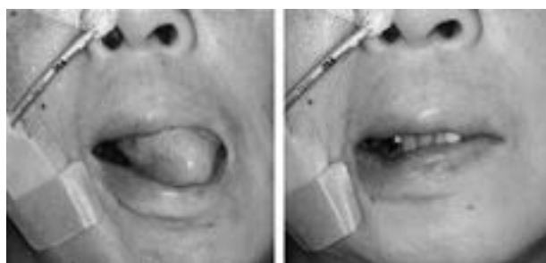
図2. パ初診時の挺舌および口角引き

残根歯多数（16, 34, 36, 45, 46, 47）につき，臼歯部での咬合接触はほとんど得られていなかった。