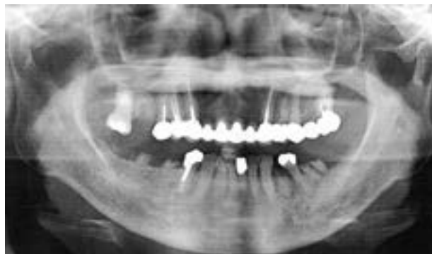
図1. パノラマ X 線写真

摂食嚥下機能評価（初回）施行。覚醒，指示理解ともに良好，経鼻胃管チューブによる経管栄養下であった。口腔内診査にて，舌苔およびプラークの付着が顕著，残根歯多数（16,34,36,45,46,47）（図1）で臼歯部での咬合支持はほぼない状態（Eichnerの分類：B2）であった。安静時より頻繁にむせを認めるも，ハフティング・咳嗽不良につき，痰を咯出しようとするも不可，安静時より湿性嘔声を認めた。顔面所見としては，閉眼・しわ寄せ左側不可，口唇閉鎖・口角引き左側不良（図2右），口唇の感覚は上・下唇ともに左側で不良であった。舌運動について，突出時左側偏位（図2左）と右側方向への運