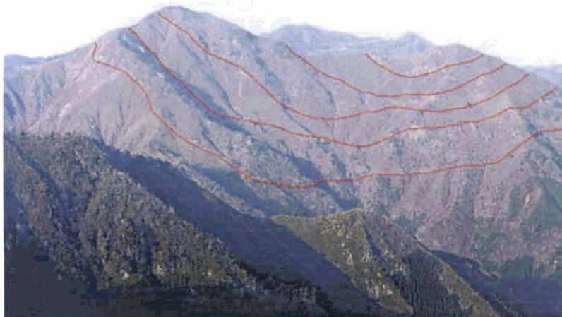
第4図. 住居附ユニットのチャートがつくる向斜構造。このような褶曲構造が、北部秩父帯の特徴の一つである。写真の横幅は約1.5km。徳島県那賀郡木沢村川成。