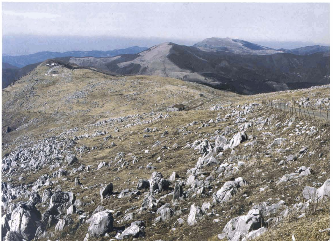
第5図. 四国カルスト。四国カルストは、沢谷ユニットのベルム系石灰岩からなっている。沢谷ユニットは、向斜軸部であり地形的高所でもある鳥形山から大野ヶ原にかけての尾根沿いに分布する。愛媛・高知県境の五段城から西方の大野ヶ原を望む。