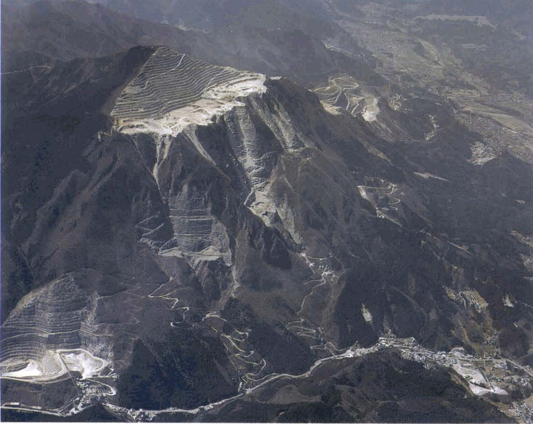
第3図. 武甲山とトリアス系の武甲山石灰岩（柏木ユニット）、武甲山石灰岩からも、テチス海要素の二枚貝動物群（ Gruenewaldia など）が産出する。柏木ユニットと三宝山ユニットの地史的関連性を考える上で興味深い。埼玉県秩父郡。