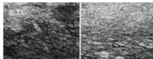
図3. 電顕像(x5000), (a: Wild-type, b: Sealマウス) SealにおいてWild-typeに比べて疎なコラーゲン線維の走行を認める。